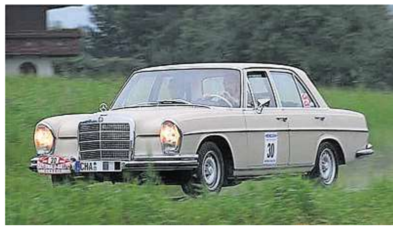
Bei den Fahrern kommt es auf Präzision an.