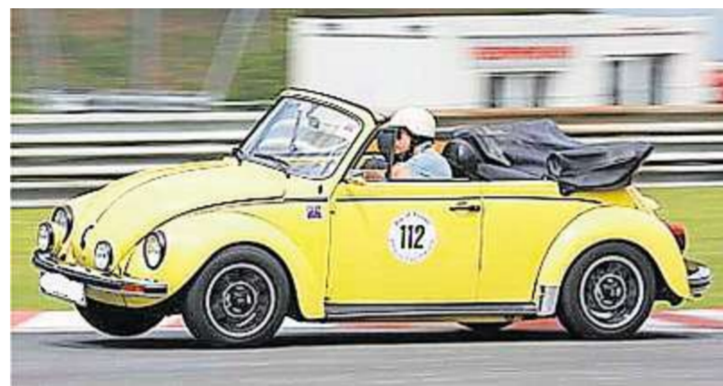
Freunde alter Autos kommen bei der Rallye auf ihre Kosten.