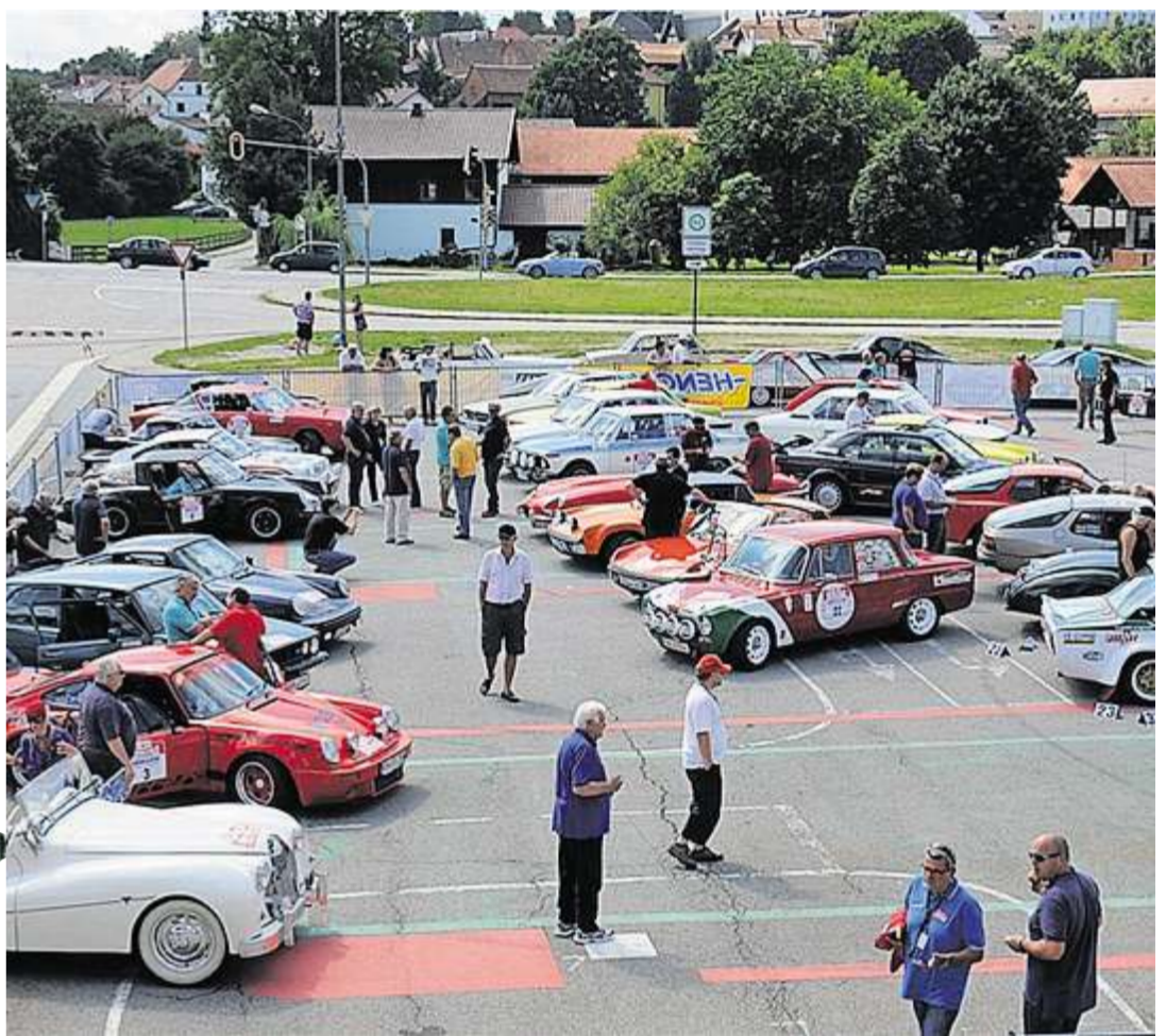
Der Jahnplatz wird zum Fahrerlager.

Die Fahrer absolvieren eine sportliche Gleichmäßigkeitsrallye mit einer Streckenlänge von 500 Kilometern, aufgeteilt in drei Etappen mit 15 Wertungsprüfungen auf Solizeit. 160 Solizeitmessungen mittels bekannter Lichtschranken auf teilweise abgesperrten Straßen sind geplant. Während die Freitagsetappe in den westlichen Bayerischen Wald führt, erwartet die Teilnehmer am Samstag eine Etappe nach Tschechien. Den Abschluss bildet der Rundkurs in Bad Kötzting. Zielankunft ist beim Bürgerfest. Übrigens: Abweichungen von der Sollzeit in den Gleichmäßigkeitsprüfungen und Schnittkontrollen sowie fehlende Durchfahrtskontrollen führen zu Zeitstrafen, deren Addition die Wertung ergibt.